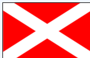
Croix de Saint-André